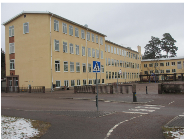
Ängarydsskolan i Tranås, delvis ritad av arkitekt Johannes Dahl.

Johan Forsander utbildades till lärare vid