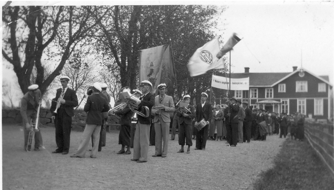
Nyktterhetsdemonstration i Norra Vi i början av 1900-talet.

I Norra Vi Hembygdskbok nr 2, som kom ut 2012, beskrev jag hur det var att tillhöra en nyktterhetsrörelse i början av 1900-talet.