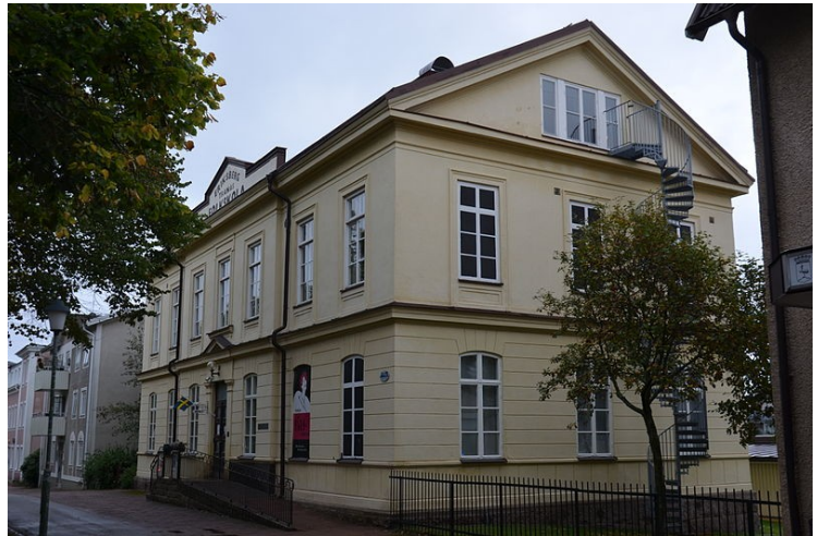
Eriksbergsskolan i Tranås