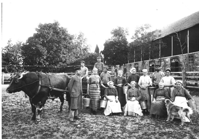
Mjölkerskor och lagårdskarlar uppställda vid Julita gård i Södermanland.

Statsystemet, eller statarsystemet var en anställningsform som med början på 1700-talet ersatte den tidigare arbetskraften i form av ogifta pigor och drängar samt dagsverken. Systemet infördes huvudsakligen vid större gårdar, gods och säterier. Processen började i Mälardalen och spred sig sedan till främst östra och västra Sveriges slättbygder samt till Skåne. I övriga Sverige fick inte statarsystemet så stor spridning beroende på det mindre antalet stora gårdar. I Småland var det bara i Kalmar län som det fick någon större spridning. Även om statarsystemet hade sin början i mitten av 1700-talet var det först 100 år senare som det ökade ordentligt i omfattning för att nå sin kulmen kring 1900 med ca 100.000 statare. Detta innebar att med familjemedlemmar närmare en halv miljon människor levde inom systemet. Därefter minskade antalet hela tiden fram till 1945 då anställningsformen avvecklades till följd av det avtal som slöts mellan Lantarbetarförbundet med ordförande Gunnar Sträng och Lantarbetsgivarföreningen.