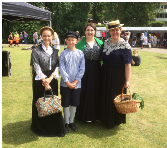
En del besökare på invigningen passade på att klä sig tidstypiskt för tiden vid utvandringen.

Arkiv Digital's utveckling och möjligheter för oss forskare. Som avslutning gav han lite för- klaring kring DNA forskningen, som nu är ett hett ämne. Hans lättsamma och intressanta föredrag var mycket uppskattat av de närva- rande.