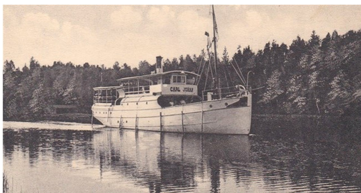
Ångbåten Carl Johan som sjösattes 1874 och som sedan gick i passagerartrafik på sjön Sommen.