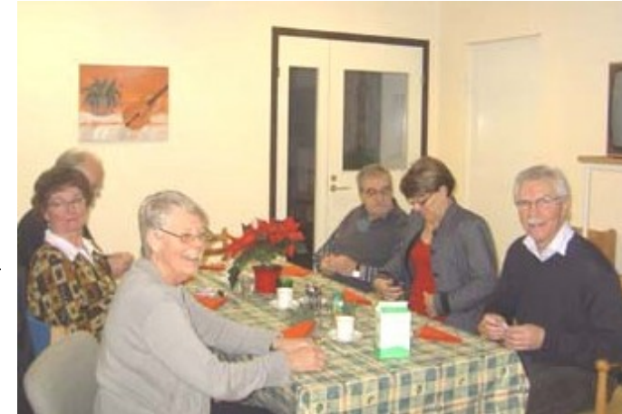
Glada miner på grötfesten i väntan på underhållning och gröttallrik.