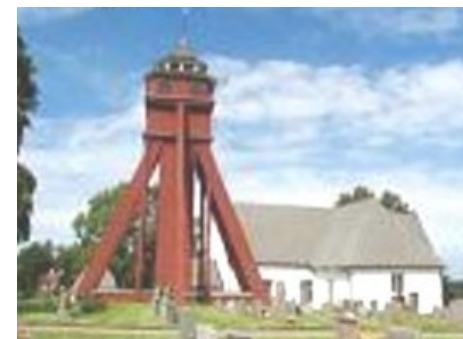
Torpa kyrka i Ydre