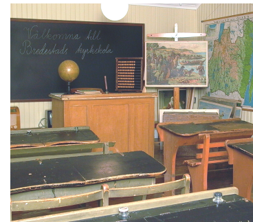
Interiör från skolmuséet i Bredestad.