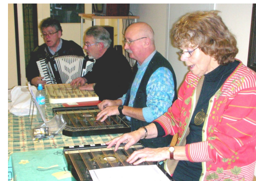
"Sommens Böljor" spelade och sjöng på grötfesten.