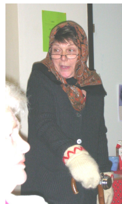
Tomtemor besökte oss

Höstens program avslutades som vanligt med grötfesten. 25 medlemmar hade mött upp för att