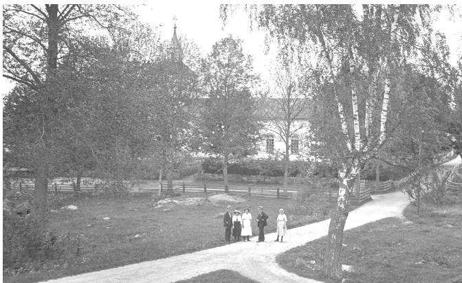
Bild från Trehörna, troligen 1930-40-tal.